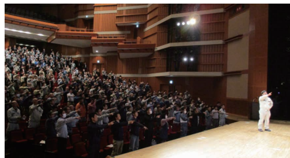
外来工事安全講習会

外来工事業者・外来工事発注者向けに安全・環境・防火・防災を考慮した講習会を連休前(春季、夏季、冬季)に実施しています。外来工事においても『災害・火災・環境事故ゼロ』を実現していきます。