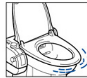
●便座が温まらない