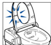
●便座が割れている

ご使用中の温水洗浄便座に、「便座が割れている」「便座コードが切れている」「便座が温まらない」「便座を固定するピンが外れている」「便座のゴム足が取れている」など、故障が疑われる症状はありませんか？今すぐご確認ください。