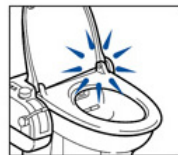
●便座固定ピンが外れている