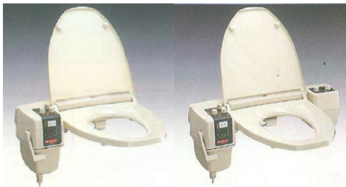
積水化学工業 ASE01 長府製作所 S-1,S-2 マキタ電機製作所 ST100