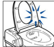
●ゴム足が取れている

「おかしい」と感じられたら、電源プラグを抜き、すぐにご使用の中止をお願いします。