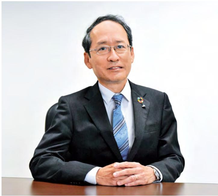
株式会社シーヴィテック 取締役社長