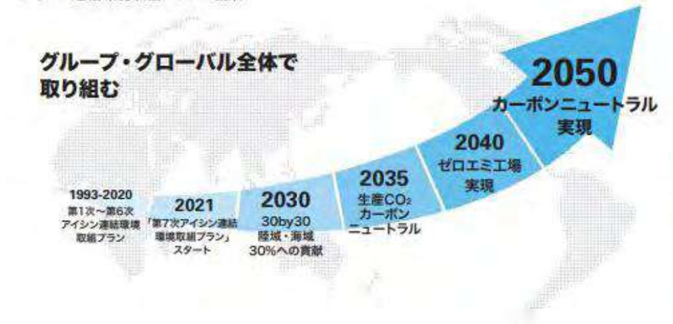
アイシン連結環境取組プランの編成

アイシングループでは、お取引先様からの原材料調達、お客様の使用、更には製品の廃棄に至る事業領域全体での環境負荷低減こそが、「持続可能な社会の実現」に繋がると考えており、2050年にライフサイクルでのカーボンニュートラル達成に向け、中間のマイルストーンとして2030年に2019年度比25%以上削減を目指します。今後お取引先様が使用するエネルギーにつきましても削減にご協力頂き、サプライチェーン全体での「カーボンニュートラル」をめざした活動を進めていきます。